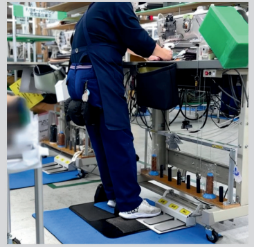
管理者・縫製作業

うちの会社は年配の方が多くいて、1日中の立ち仕事は身体への負担が大きい。負担で仕事を続けることが難しいという方も、楽に仕事ができるようになった。