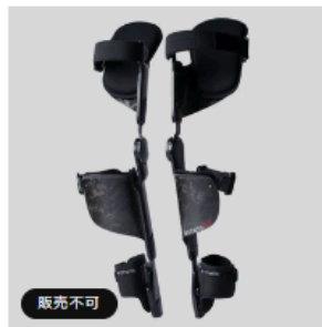
アルケリス (アシストスーツ) ¥437,800 JPY