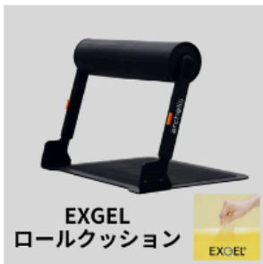
EXGEL ロールクッション