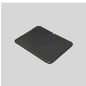
疲労軽減ジェルマット Mサイズ [EGM30-ARC] ¥22,000 JPY