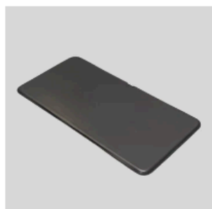
疲労軽減ジェルマット Lサイズ [EGM31-ARC] ¥30,800 JPY