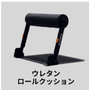
ウレタン ロールクッション