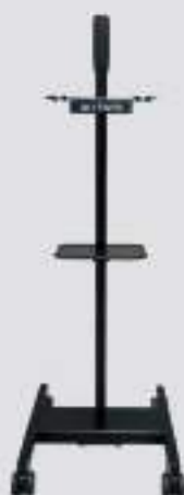
ホイール付き専用スタンド