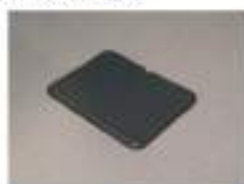
Mサイズ 仕様：W600×D450×H11 (mm) 重量：1.7kg