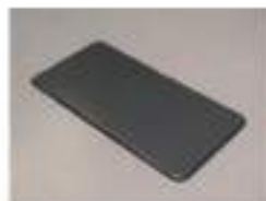
Lサイズ 仕様：W900×D450×H11 (mm) 重量：2.5kg